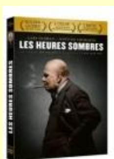
Les heures sombres