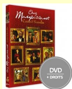
Contes et nouvelles de Maupassant